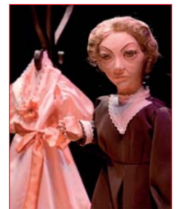
Avoa de Mina