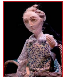
A vella dos chícharos