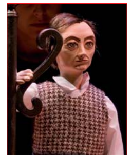
Pai de Mina