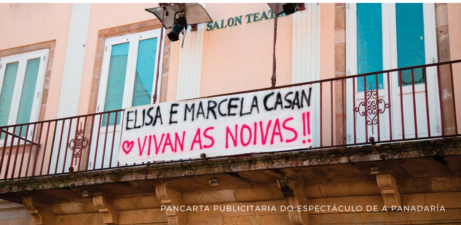
PANCARTA PUBLICITARIA DO ESPECTÁCULO DE A PANADARÍA