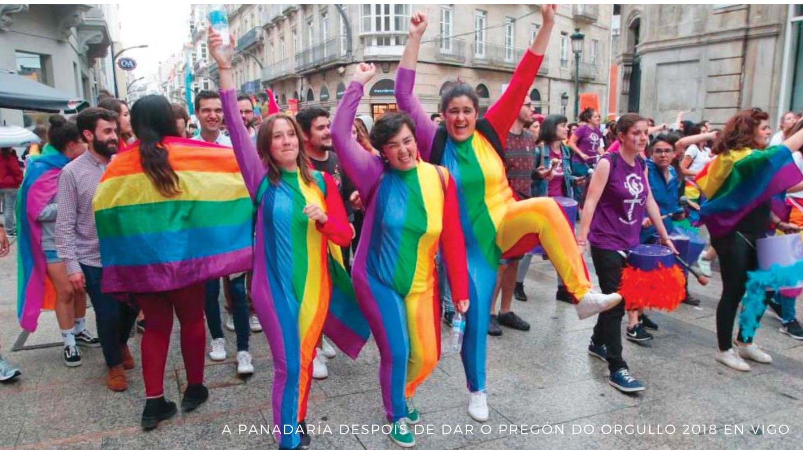
A PANADARÍA DESPOIS DE DAR O PREGÓN DO ORGULLO 2018 EN VIGO